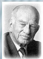
J.W. Fulbright Senador de Arkansas

Propuso al Congreso EE.UU. la idea de crear un programa de intercambio educacional